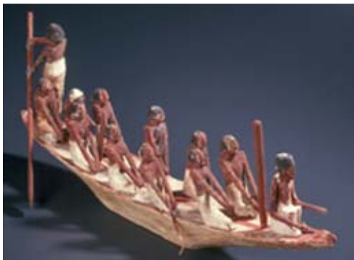
Inv. E963 à 965 : modèles de barques de plaisance