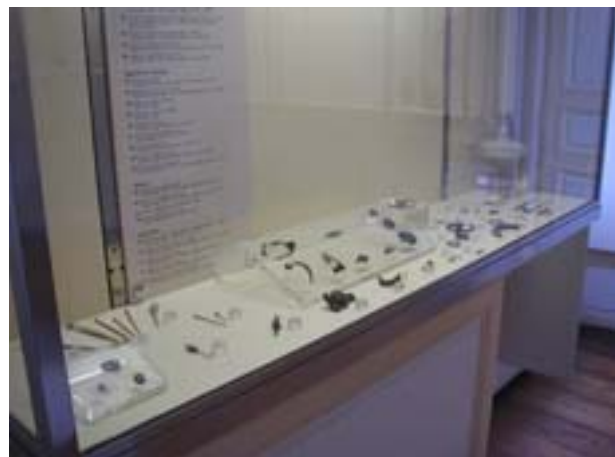
Vitrine des bijoux et de la parure.