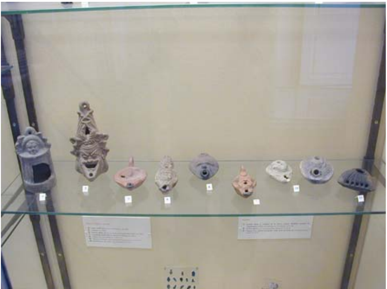
Vitrine des lampes à huile