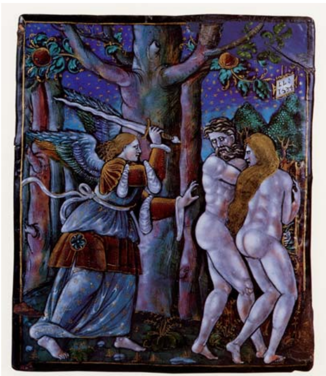
Léonard Limosin Adam et Eve chassés du Paradis, 1534 Email peint sur cuivre, rehauts d'or Achat, 1984 Inv. 392