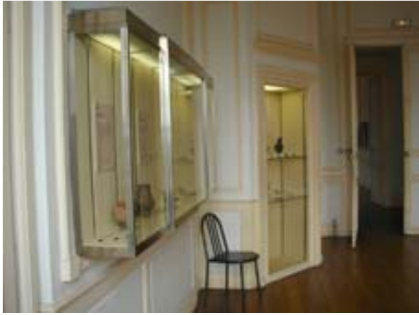
Vue de la salle du mobilier domestique : vitrine de l'écriture et de l'éclairage.