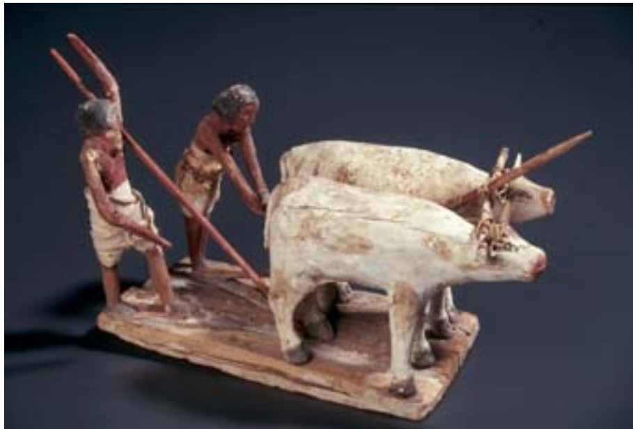
Inv. E962 : modèle de labours (deux hommes)