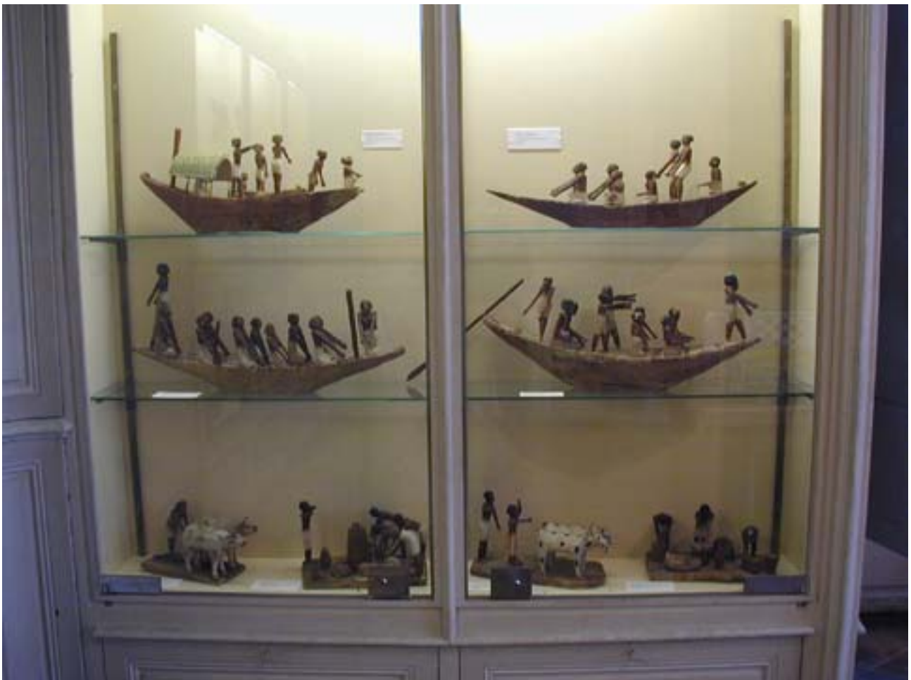
Vitrine des modèles égyptiens