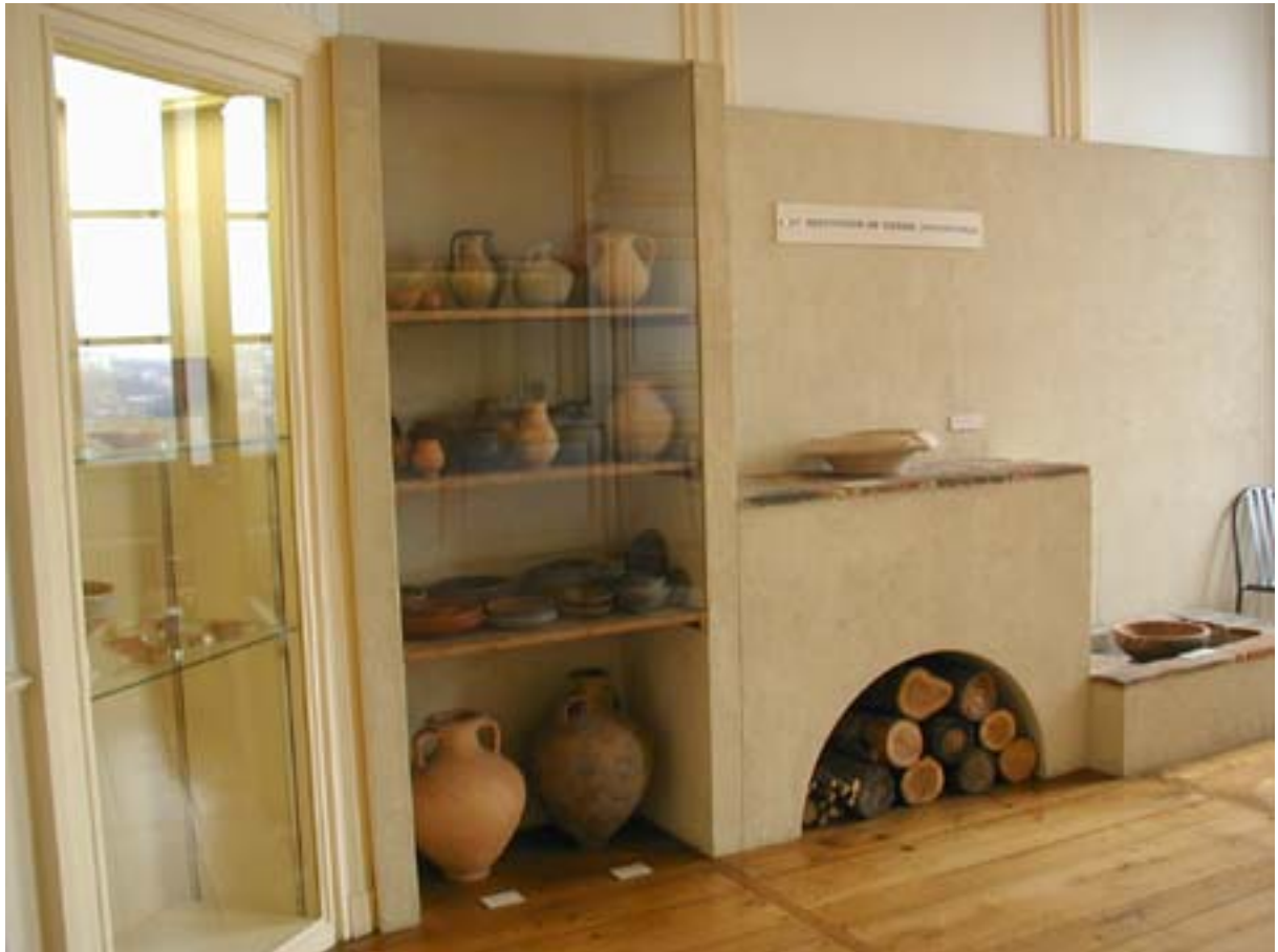
Vue de la salle du mobilier domestique.