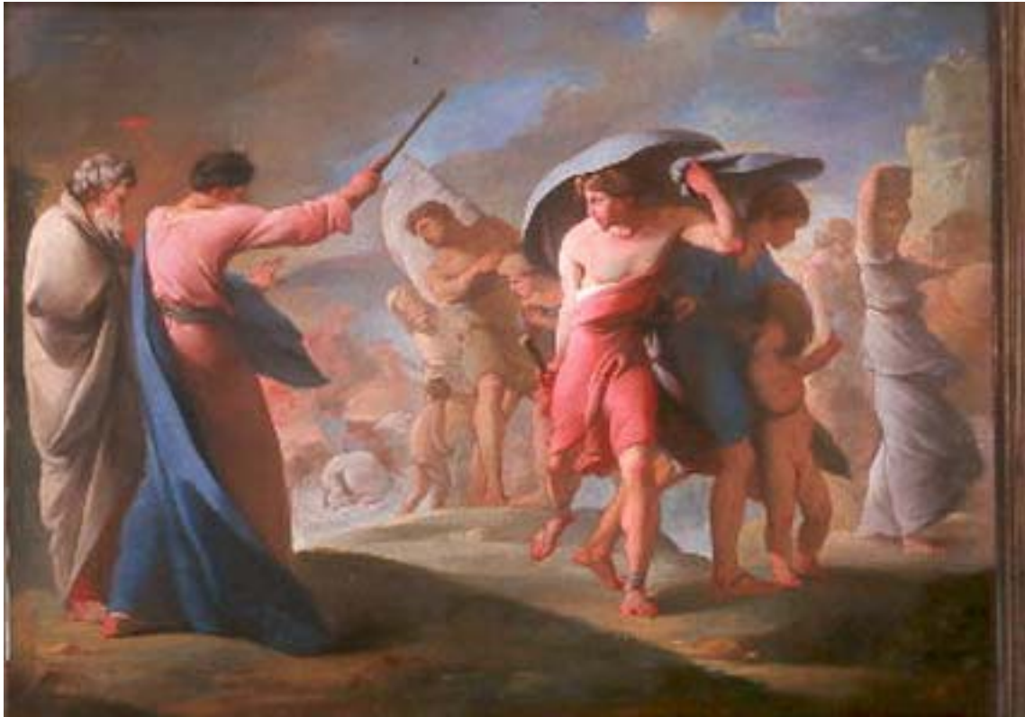
France, XVIIIe siècle : attribué à Lubin Baugin ou à Eugène Lesueur ? Le passage de la mer Rouge Huile sur toile Dépôt du musée national de la porcelaine Adrien Dubouché, 1963 Inv. P170 Cliché Musée municipal de l'Evêché/ F. Magnoux.