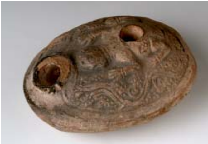
Lampe à huile avec une grenouille et des pampres, époque copte, inv. E174