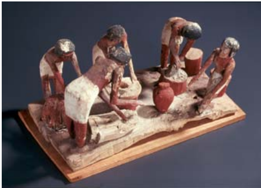
Inv. E968 : modèle de la fabrication du pain et de la bière