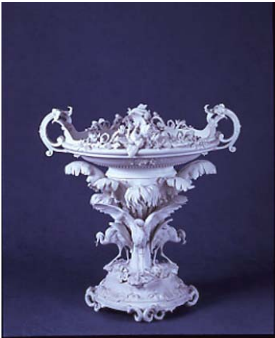
Manufacture Pouyat, modèle de Paul Comoléra Surtout du service Cérés riche Biscuit de porcelaine dure Limoges, 1855 Don de la manufacture Pouyat, 1867 ADL 3545