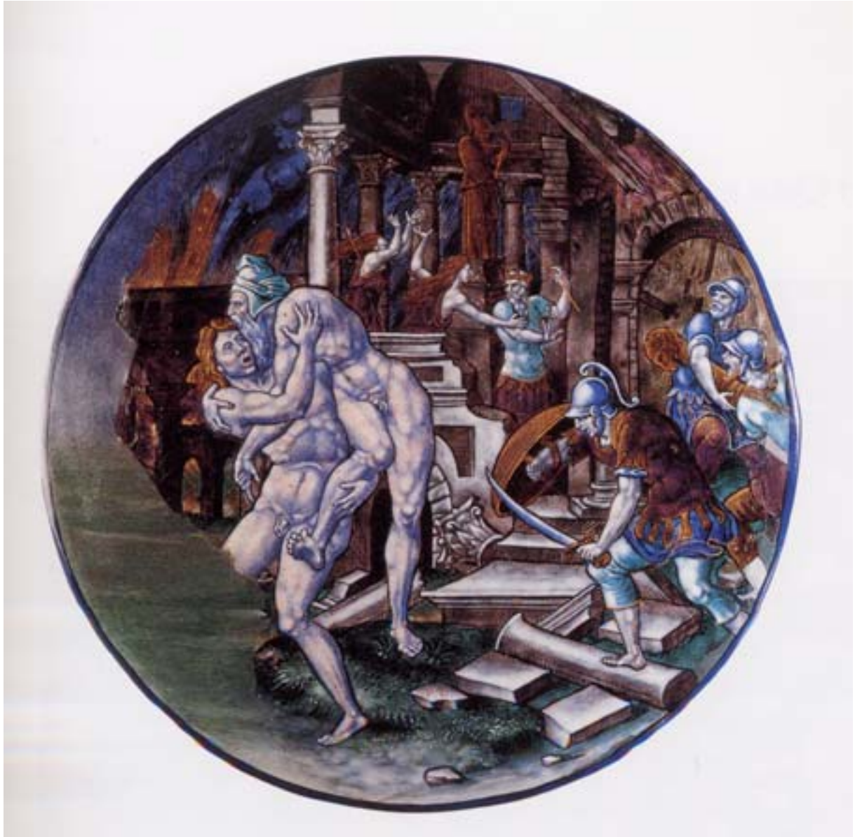
Pierre Courteys Enée fuyant Troie en flammes Email peint sur cuivre Dépôt du Louvre, 1895 (MR R276) Inv. 43