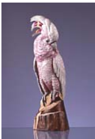
Cacatoès Porcelaine dure Manufacture Théodore Haviland Limoges, modèle créé en 1928, édition après 1950 Don Haviland 1982 – ADL 9096