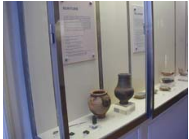
Vitrine de l'écriture et de l'éclairage.