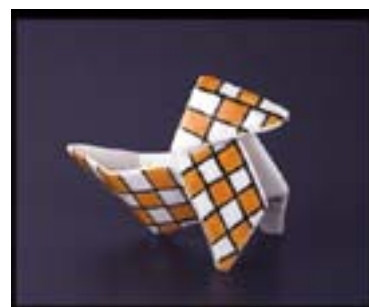
Cocottes-salières Porcelaine dure Manufacture Théodore Haviland Limoges, 1921 Don Association Adrien Dubouché 1996 - ADL 10612