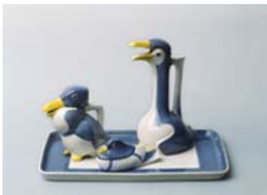
Tête-à-tête rectangulaire Canard Porcelaine dure Manufacture Théodore Haviland Limoges, vers 1917 Acq. 1991 - ADL 10019-10024