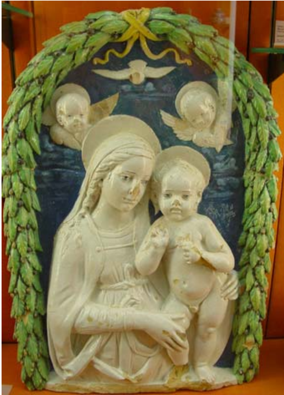
Atelier des Della Robbia Bas-relief : Vierge tenant l'enfant Jésus sur ses genoux Faïence polychrome de grand feu Florence, début du XVIe siècle ADL 5436