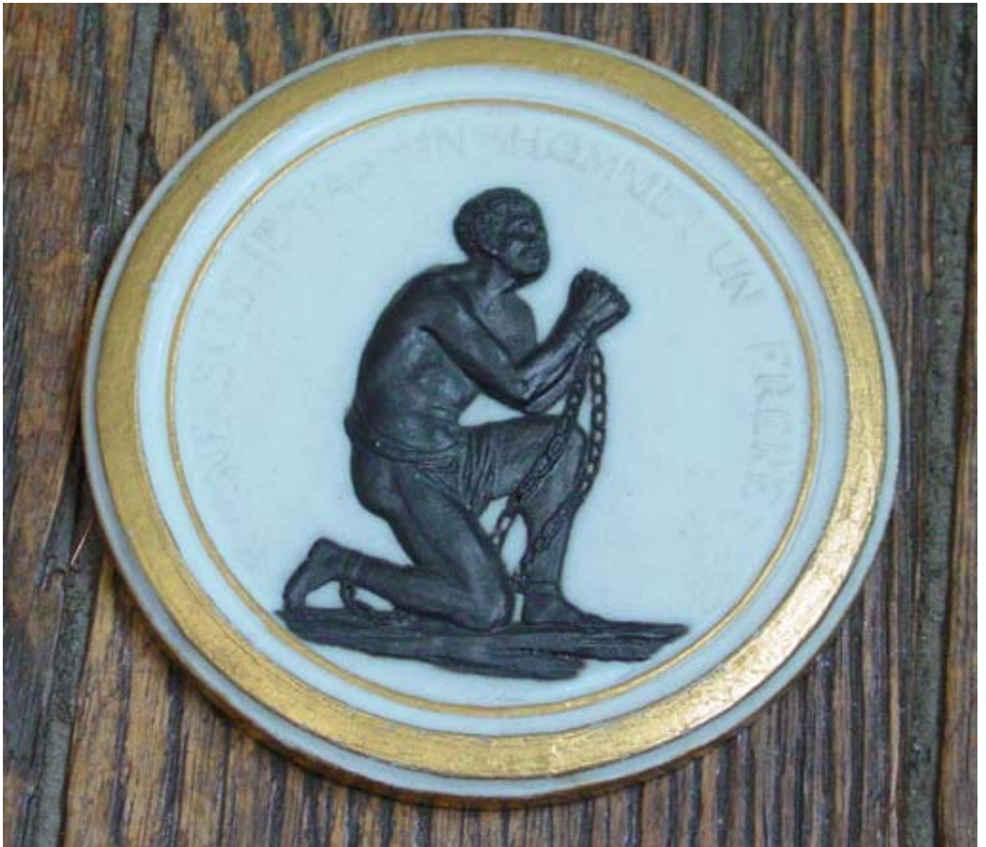
Manufacture de Sèvres Médailon : « Ne suis-je pas un homme, un frère? » Biscuit de porcelaine tendre Sèvres, vers 1788 Ancienne collection Gasnault Don A. Dubouché 1881 – ADL 1342