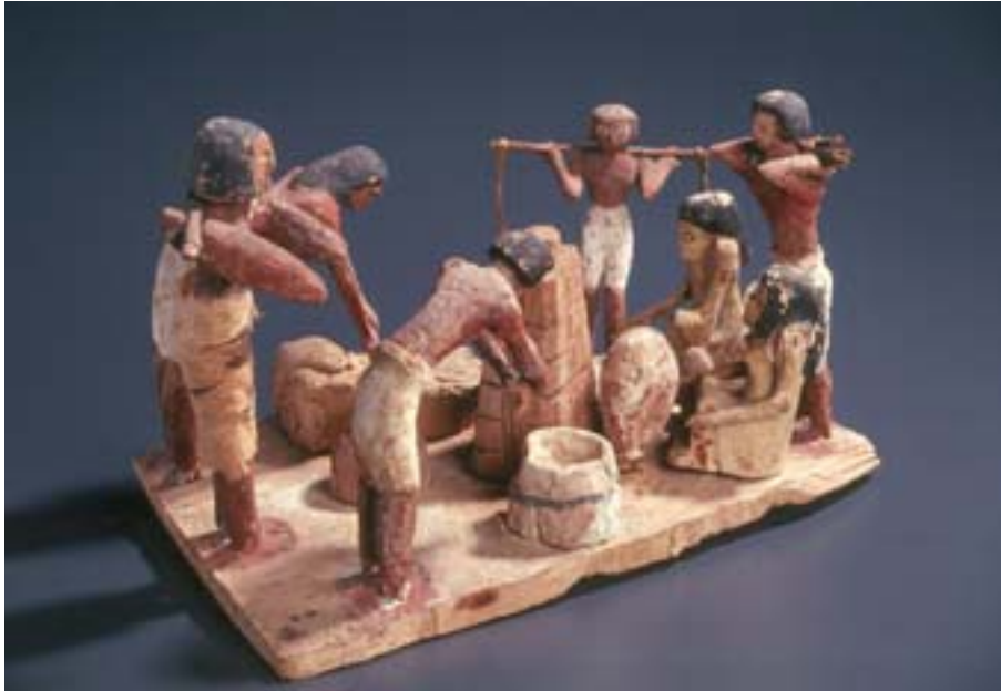
Inv. E969 : modèle de la fabrication du pain