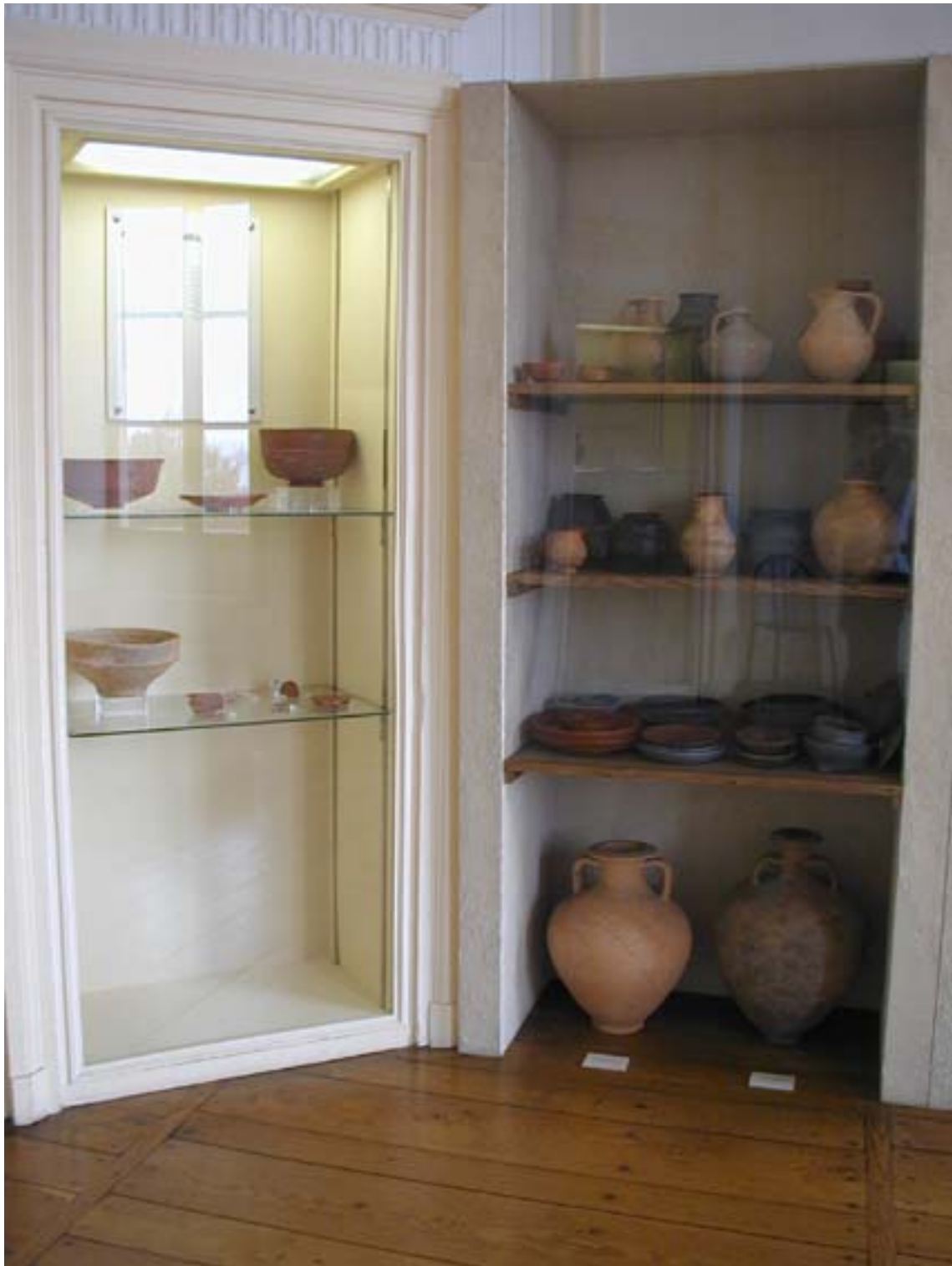
Vitrines de céramiques sigillées et de céramiques communes.