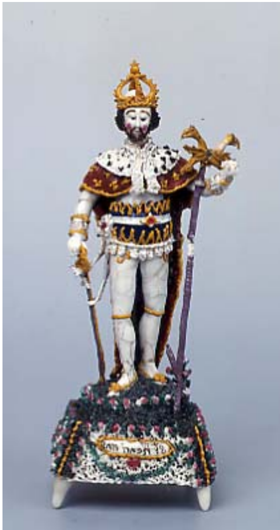
Statuette : saint Henri Verre filé Nevers, XVIII e siècle Anc. coll. Gasnault Don A. Dubouché 1881 ADL V 160