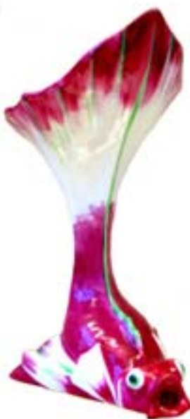
Vase Poisson de Chine Porcelaine dure Manufacture Théodore Haviland Limoges, 1917 Acq. 1998 - ADL 10703