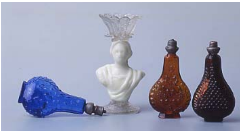
3 flacons piriformes Verre à fruit Bernard Perrot Orléans, XVII e siècle Anc. coll. Gasnault Don A. Dubouché 1881 ADL V 156 à 158, 165