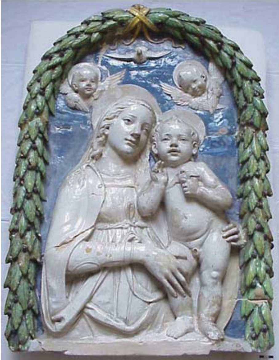
Avant restauration