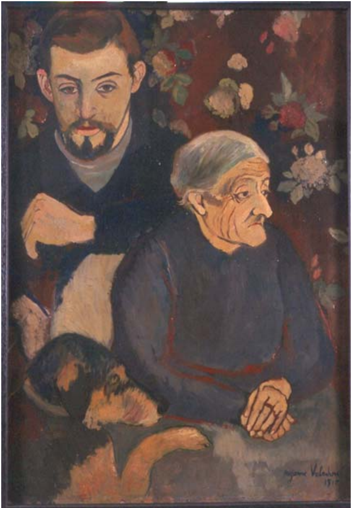
Suzanne Valadon (Bessines, 1865 - Paris, 1938) Portrait de Maurice Utrillo, son chien et sa grand-mère , 1910 Huile sur toile Dépôt du musée national d'art moderne, 1999 Inv. 999.D1.1