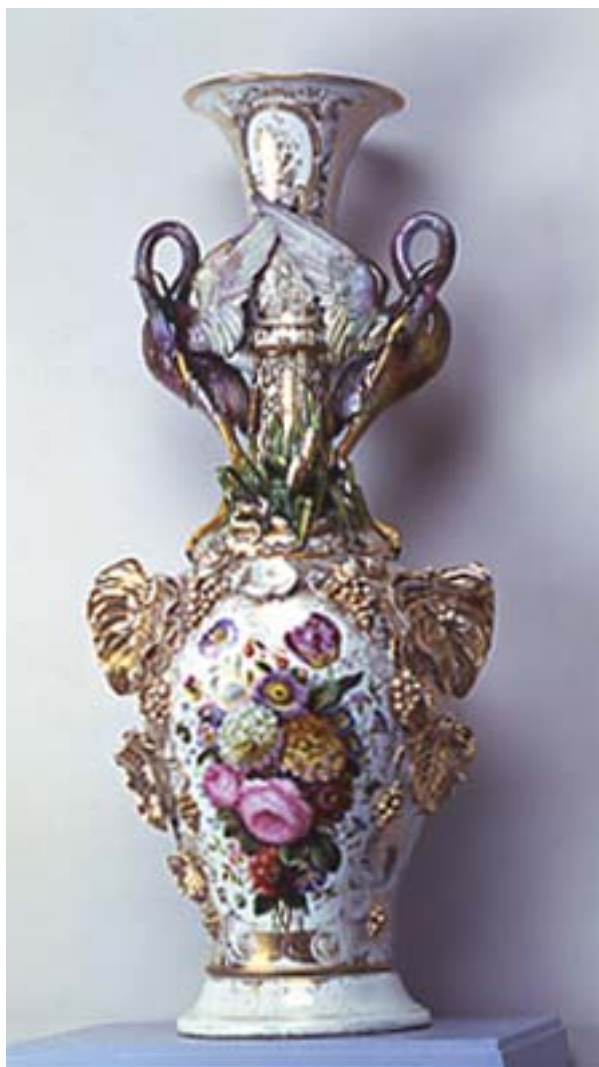
Manufacture Valin et Berthoud Vase aux hérons Porcelaine dure Limoges, 1855 Acquis en 1984 - ADL 9198