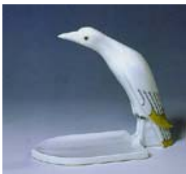
Vide-poche Merle blanc Porcelaine dure Manufacture Théodore Haviland Limoges, 1922 Don Haviland 1928 - ADL 2705