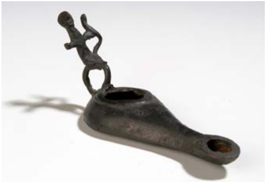
Lampe avec anse anthropomorphe, bronze, inv. E544